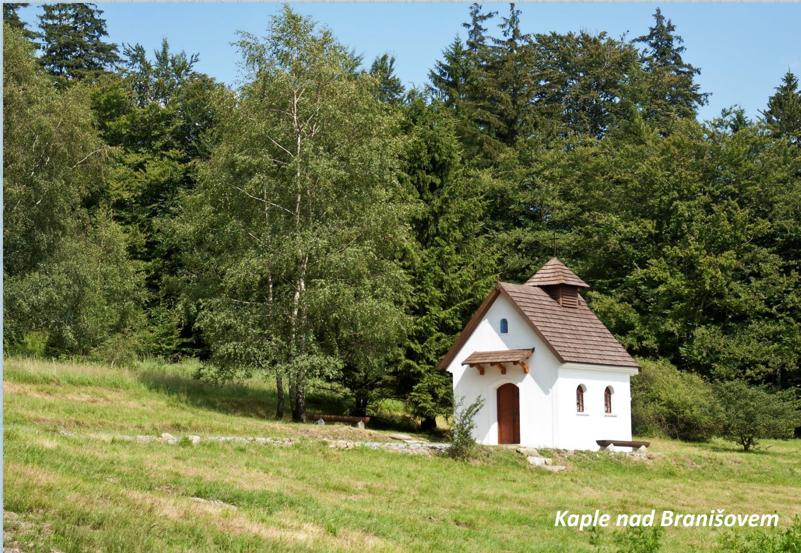
Kaple nad Branišovem