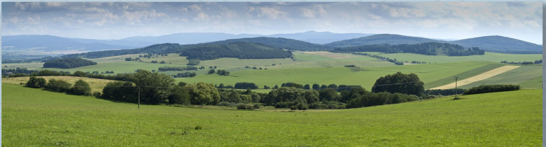
Pohled z vyhlídky nad Dobříkovem

Jádro Modlína tvoří 3 usedlosti seskupené kolem staré lípy, v jejímž stínu stávala stará chlebová pec. Ze Smržovic stoupá k Modlínu silnička lemovaná starými třešňovými stromy. Z pastvin v okolí Modlína se otevírají překrásné pohledy na Šumavu a Český les. Modlín je místem, které si po staletí udrželo stejnou tvář a úspěšně odolává všem civilizačním zásahům.